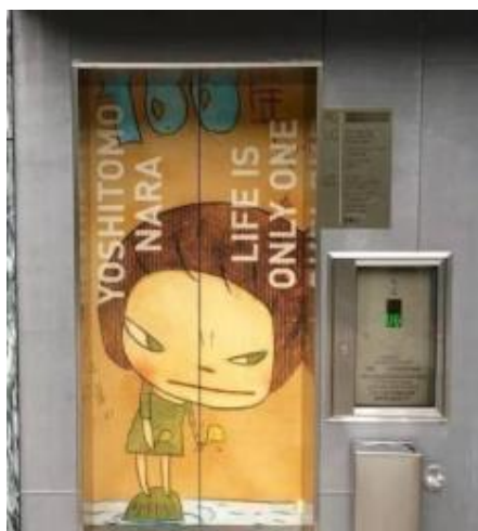
(圖五) 奈良美智 貼在亞洲協會香港中心升降機的作品，帶領我們走入《無常人生》

奈良美智(1959~)說過「孤獨和疏離感是我創作的動力」。她的作品受動漫、搖滾流行文化的影響，畫作經常出現孩童充滿童稚卻又帶著苦惱或氣憤的神情，孤獨的畫面下有被壓抑的叛逆感，眼神似乎訴說著內心的矛盾情緒；他筆下的大眼娃娃 Mori 表達各種憤怒與不屑的情感，令人留下深刻的印象，窺探他對生命和死亡的看法，從而反思自己的生活意義。後期的他也將夢遊娃娃沉浸在美妙的夢想中的暖意透過作品傳達給我們。