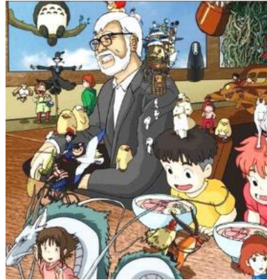
（圖七）宮崎駿卡通人物 作品集圖

著名日本國寶級動畫大師宮崎駿（1941～）本身對飛機特別感興趣，因此許多作品反覆出現飛行概念，他以傳統手工繪製動畫，電影使用數位塗料，他的動畫電影部部經典，大多涉及人類與自然間的關係、兒童心理及青春期的思想、和平主義、女權運動等，動畫作品以高品質著稱，細膩、富有生氣、充滿想像力的作品在全世界獲得極高的評價，終身獲得許多不同的國際獎項。