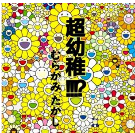
(圖三) 村上隆 太陽花