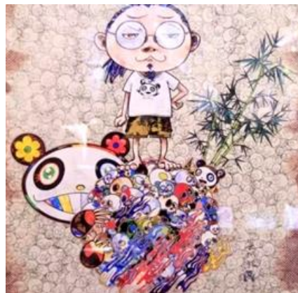
(圖四) 村上隆 我遇見了熊貓