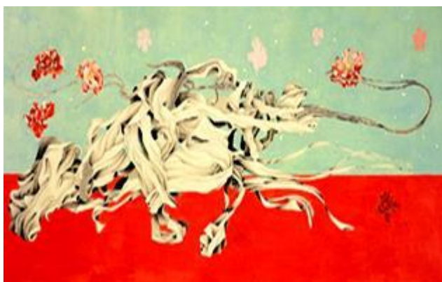
(圖十一) 袁旃《動》彩絹 87×138.2cm 2006

袁旃（1941～）轉借或挪移古畫與青銅器等古文物裡的元素，以西方「幾何」概念表現山巒的稜角，運用抽象概念在同一個畫面上營造許多幻想或真實的景緻，他認為每個民族有它自己獨特的色彩，必須掌握其文化特色，因此他用繽紛亮麗之重彩跳脫傳統之水墨用色，營造一種奇妙的「異山水」獨特風格，並以自己的當代生活語彙融合表現，賦予作品一股天真爛漫、富有童趣的氛圍。以上幾位藝術家在個人作品的表現上求新求變，為傳統水墨及療癒藝術開闢一條通往當代的路徑。