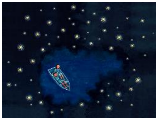
(圖九) 關於長大：童年沒有說再見就走了，寫給與世界斷了聯繫的孩子