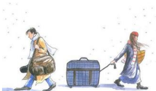
(圖十) 關於錯過：適應都市的冷漠不是成長的一部份