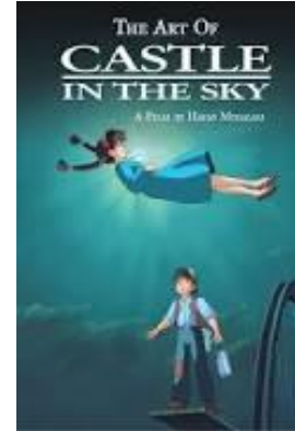
（圖八）宮崎駿『天空 の城ラピュタ』海報