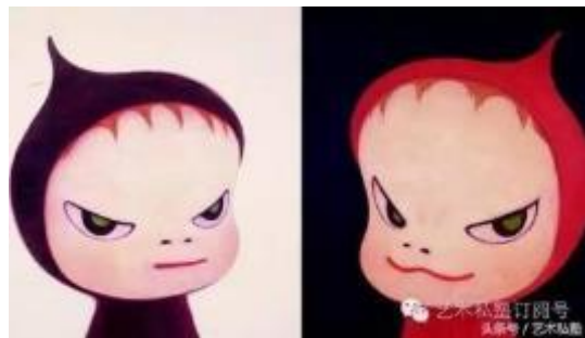
(圖六) 奈良美智 〈邪惡娃娃〉