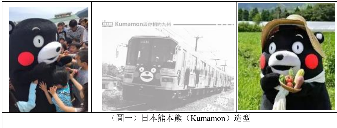
(圖一) 日本熊本熊 (Kumamon) 造型

美國猶太裔人本主義心理學家亞伯拉罕·馬斯洛 (Abraham Maslow 1908~1970) 以「需求層級理論」來闡釋互動關係中的情境，運用「生理」、「安全」、「歸屬」與「愛」、「自尊」、「自我實現」及「自我超越」等描述人類動機移轉的脈絡；其理論基本的假設是，人類的需要是以層次的形式出現，人們在生存條件滿足之後，接下來會尋求愛、歸屬感、和地位等等非物質性的目標，也就是個人情感需求上的滿足；自我實現是一種成長性動機，不是匱乏性動機，人類的發展和持續成長依賴自我的潛力和潛在的資源 1 。當我們在生活中感受到自我內在出現了某一種情緒，該情緒若可以透過個人的智慧或經驗去處理時，容易把焦點挪移到自我的身上，讓自己可以在各種不同的關係互動中去釋放當時的情緒，或是因為對於整個事件有所體悟，產生靈感去喚醒並省視自我內在的生命價值，而讓禁錮的心靈得以重新獲得釋放及解脫。