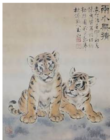
圖 38 林玉山，〈兩小無猜〉，年代未詳，彩墨紙本，設色，46.5x37 公分