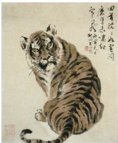
圖 50 林玉山，〈回首猛虎〉，1986，彩墨設色，75x61 公分，私人收藏