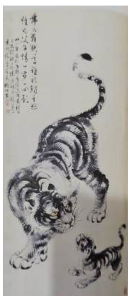
圖 41 林玉山，〈父子情〉，1973，彩墨紙本，設色，136x67 公分