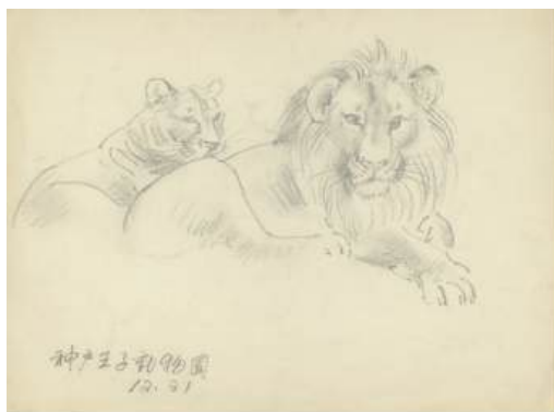
圖 29 林玉山，〈神戸王子動物園（獅）〉，年代未詳，鉛筆紙本，設色，25x 34 公分，國立臺灣美術館典藏

老虎是百獸之王、叢林之王，老虎是古今中外藝術家熱中描繪的對象，在動物繪畫佔有一席之地。十九世紀晚期的英國維多利亞時期，老虎成為一種象徵符號以指涉、宣傳以及合理化當時英國對印度的殖民統治；對於西方藝術家來說，描繪原生於亞洲的老虎更挾帶了另一重他者的凝視，其在東方文化象徵威武與勇氣動物 40 ，如同西方之王獅子。畫家林玉山有「臺灣畫虎第一人之美稱」，1974年於〈畫虎漫談〉 41 一文，藉由藝術家的現身說法，看到前輩畫家對老虎的細緻觀察和研究。德拉克洛瓦和林玉山二位畫家皆著迷於走獸動物創作，諸如老虎、豹和獅子，都是他們鍾愛的題材，以及對自然世界的迷戀。其中，「老虎」題材是二位大量創作的重要主題。