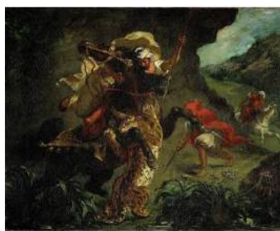
圖 77 德拉克洛瓦，〈獵虎〉 la chasse aux lions (the Lion Hunt) ，1854，油彩畫布，73.5x 92.5 公分，法國巴黎羅浮宮(Musée du Louvre)典藏