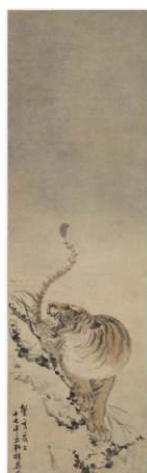
圖 92 林玉山，〈下山猛虎〉，1923，彩墨淡彩紙本，設色，132.1 x 39.1 公分，國立臺灣美術館典藏