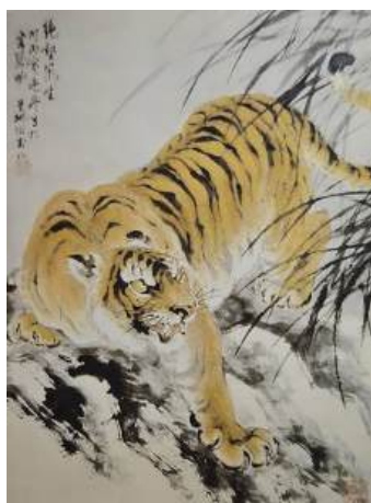
圖 59 林玉山，〈絕壑風生〉，1986 年，彩墨紙本，設色，60x80 公分，私人收藏