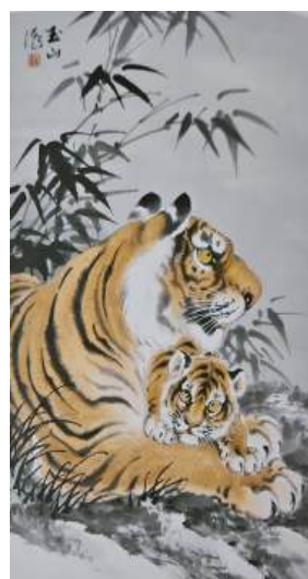
圖 40 林玉山，〈老虎〉，1975，彩墨紙本，設色，69.5x42.2 公分，私人收藏（寄存創價文教基金會）