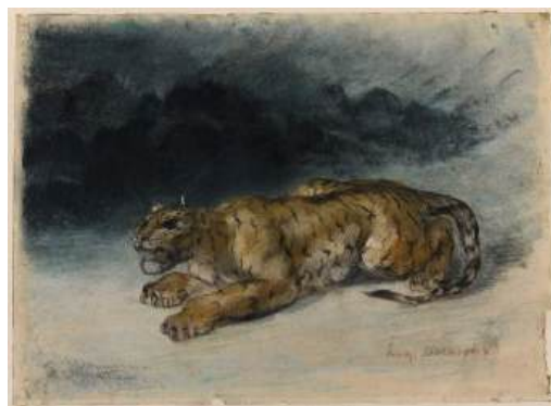
圖 53 德拉克洛瓦，〈老虎準備好春天〉 Tiger Preparing to Spring ，年代未詳，紙上粉彩，23x31 公分

林玉山畫面中以濃淡粗細的筆墨描繪老虎的身軀動態，淺黃毛色與咖啡條紋相間，其警覺銳利的眼神，細膩而生動；周遭草叢和竹子是東方常見的元素，使用潑墨暈染的寫意畫法。瞳孔縮小如豆，眼白處呈金黃泛青綠色，耳朵向後平伏，眼神眈眈注視遠方，軀體表現警戒狀態，畫面氛圍凝結。〈未嘯起寒風〉、〈絕壑生風〉或是〈虎嘯圖〉呼應林玉山〈畫虎漫談〉「未嘯已生風」之詩句，他分析道：「老虎兇猛之相，一般都認為是在開口咆哮之態，其實還未及開口，正低鳴緩施雷威之表情更為喪膽，未發嘯時已有醒風襲人之意」。 58 另外，背景與虎站立的橫倒樹幹或是躡足於樹幹上的老虎，頭低伏；背拱起，虎匍匐於地，撲擊待發，則以黑色淡墨暈染刷筆的技法，藉此凸顯黃色的虎。