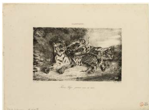
圖 95 德拉克洛瓦，〈一隻小老虎和牠的媽媽一起玩耍〉 A Young Tiger playing with its Mother ，1831 年，石版畫印刷，11.2x18.7 公分