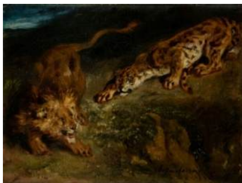
圖 78 德拉克洛瓦，〈獅子和老虎，戰鬥〉 A Lion and a Tiger, Fighting ，1850，布面油畫，23x30.5 公分