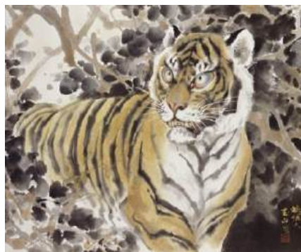
圖 128 林玉山，〈眈眈〉，1972，彩墨紙本，設色，61x74 公分，臺北市立美術館典藏