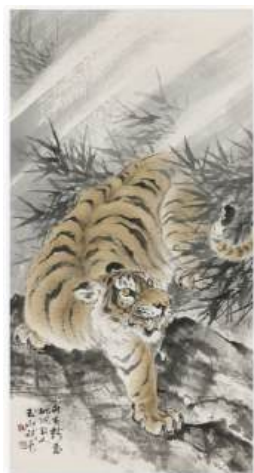
圖 55 林玉山，〈畫虎圖〉，1986，彩墨紙本，設色，90x47 公分，國立臺灣美術館典藏

作品反而較少，有〈老虎和蛇〉和〈老虎準備好春天〉，不管是油畫還是粉彩畫，其虎較為僵硬靜態，畫面中的虎似乎也較具孤獨之感或更為兇猛。