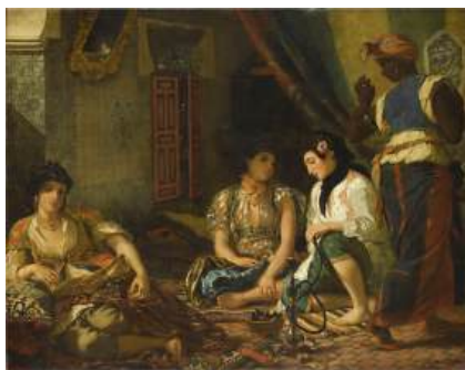
圖 13 德拉克洛瓦，〈公寓裡的阿爾及爾女士〉 Women of Algiers in their Apartment 第一版，1834 年，布面油畫，180x229 公分，法國巴黎羅浮宮(Department of Paintings of the Louvre, Musée du Louvre)典藏