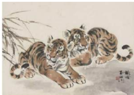
圖 125 林玉山，〈二隻老虎〉，尺寸不詳，彩墨紙本，設色，尺寸未詳，私人收藏

布萊森(Norman Bryson)在《視覺與繪畫》 Vision and Painting (1983 年)一書的觀點，認為中國繪畫史中展示一件作品的製作過程，而西洋繪畫卻始終掩飾這一種過程（這是一種抹拭媒介 “It is an erasing medium.”）。媒介的選擇與決定可以看出這種說法，毛筆繪畫的線條一經畫出，就難以掩飾甚至修改，故需要一筆完成，十分考驗畫家的功力，而油畫的筆觸是總能被覆蓋、塗改與修改。可見在西方，畫家揭示他的個性，而在東方中國，則是揭示毛筆畫出的線條以及作畫的過程。 100