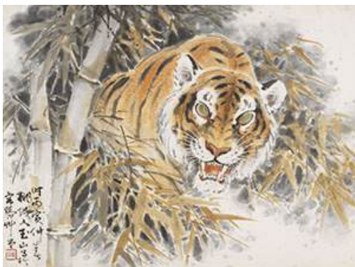
圖 129 林玉山，〈老虎〉，1896，彩墨紙本，設色，49x64 公分，私人收藏