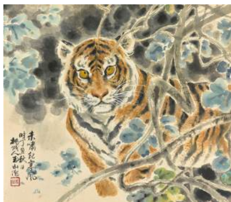
圖 131 林玉山，〈未嘯起寒風〉，1997，水墨設色，45x52 公分，嘉義市政府文化局典藏室典藏