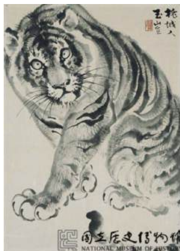
圖 51 林玉山，〈斗方虎〉，年代未詳，水墨紙本，54.2x38.8 公分，國立歷史博物館典藏