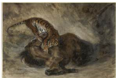
圖 88 德拉克洛瓦，〈野馬被虎撲倒〉 Wild Horse Felled by a Tiger , 1828, 油彩畫布， 13.5x 20.2 公分，美國紐約大都會博物館 (Metropolitan Museum of Art) 典藏