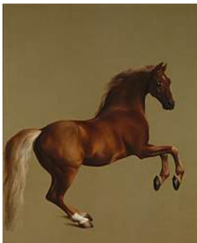
圖 1 喬治·斯塔布斯(1724-1806)，〈哨夾克〉 Suspense ，1762，布面油畫，292x246.4 公分，英國倫敦國家美術館(National Gallery) 典藏

從古到今，畫家除歷史畫、肖像畫、風景畫和靜物畫的畫種創作題材，也大量創作動物畫。不同世紀也有不少以動物主題或題材的動物畫家(Animal Painter) 1 ，動物畫家喜愛創作動物題材的作品，甚至有些動物畫作成了畫家們的代表性畫作。