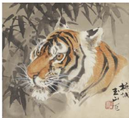
圖 1301 林玉山，〈老虎〉，年代未詳，彩墨紙本，設色，22.5x26 公分，私人收藏