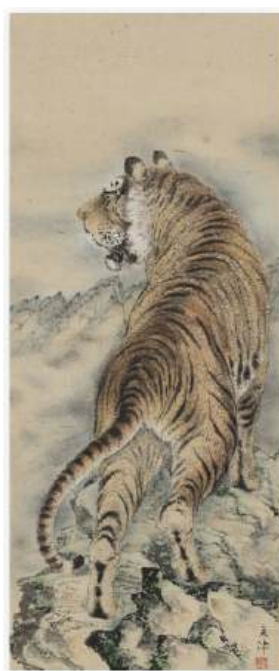
圖 19 呂孟津，〈老虎圖〉，年代未詳，彩墨淡彩紙本，設色，119.5 x 48 公分，國立臺灣美術館典藏