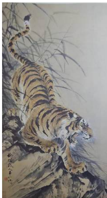
圖 64 林玉山，〈虎嘯圖〉，年代未詳，彩墨紙本，設色，106.5x54.5 公分，國立歷史博物館典藏