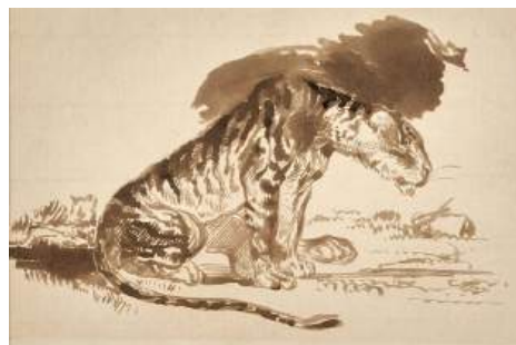
圖 101 德拉克洛瓦，〈景觀中的老虎〉 Tiger in Landschaft , 年代未詳，筆、毛筆和鐵膽墨水，12.5x18 公分，美國紐約大都會博物館 (Metropolitan Museum of Art) 典藏