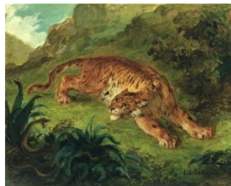
圖 81 德拉克洛瓦，〈老虎和蛇（被蛇驚嚇的老虎）〉 Tiger and Snake (Tiger Startled by a Snake) ，1858，油彩畫布，32.4x 40.3 公分，德國漢堡美術館(Kunsthalle, Hamburg) 典藏