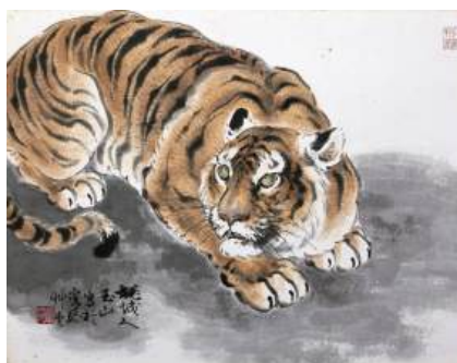
圖 71 林玉山〈虎視眈眈〉，1974，彩墨紙本，設色，38x50 公分，長流美術館典藏