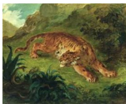
圖 87 德拉克洛瓦，〈老虎和蛇（被蛇驚嚇的老虎）〉 Tiger and Snake (Tiger Startled by a Snake) , 1858, 油彩畫布，32.4x 40.3 公分，德國漢堡美術館(Kunsthalle, Hamburg)典藏