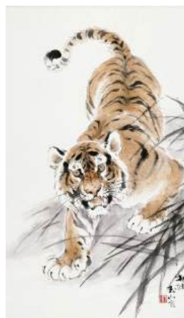
圖 93 林玉山，〈猛虎下山〉，年代未詳，彩墨紙本，設色，60x36 公分，長流美術館典藏