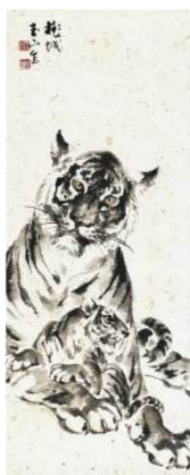
圖 39 林玉山，〈老虎〉，年代未詳，彩墨紙本，設色，71x28 公分，私人收藏