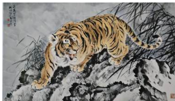
圖 62 林玉山，〈虎〉，1971，彩墨紙本，設色，67.5x120 公分，私人收藏