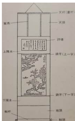
圖 133 東方水墨和彩墨作品裱框方式

在藝術史裡，甚少談及畫框與卷軸的問題，儘管它們在符號學的範疇被探討過。 104 從畫幅和畫框來看，德拉克洛瓦幾乎以橫幅的老虎作品為主；而林玉山直式和橫幅的老虎作品皆有，不過以直式的虎作為主，並且畫面多留白，以此營造簡潔之效果。此外，裝裱的方式也有所不同，東方虎畫以水墨為主要，並且以「裝池和裱褙」為主，在畫背襯糊一或數張宣紙，再依立軸、手卷、冊頁的區別，把畫（或宣紙）鑲嵌在綾緞上加軸軒，或包上外皮（可見下圖解說） 105 。西方虎畫則是以油畫為主，其他媒材為輔（如：水彩或是粉彩等），並以畫框裱框起來，框裱好的畫作以二側固定的形式添加適當強度的懸掛金屬線，邊框並以花邊美化，可見裱框方式亦有所差異。