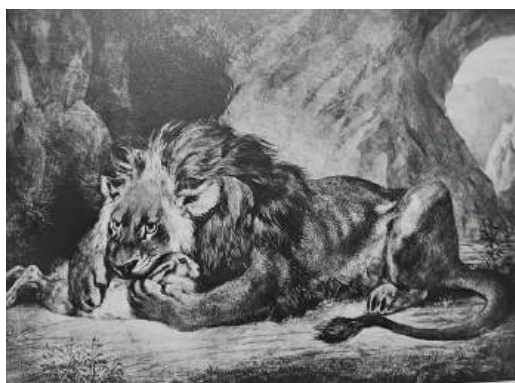
圖 10 德拉克洛瓦，〈阿特拉斯山脈的獅子〉 Lion of the Atlas Mountains ，年代未詳，平版印刷，33x 46.7 公分，美國紐約大都會博物館(Metropolitan Museum of Art) 典藏