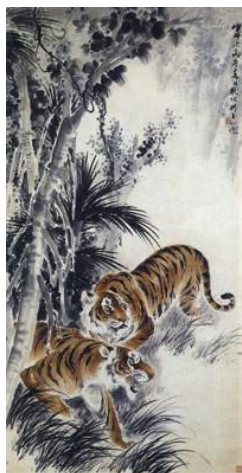
圖 98 林玉山，〈雙虎圖〉，1995，彩墨紙本，設色，167x91.5 公分，國立歷史博物館典藏