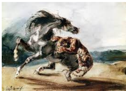
圖 76 德拉克洛瓦，〈老虎攻擊野馬〉 Tiger Attacking A Wild Horse ，年代未詳，油彩畫布，17.9x 24.9 公分，法國巴黎羅浮宮(Musée du Louvre)典藏