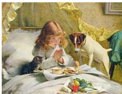
圖 4 查爾斯·伯頓·巴伯，〈懸念〉 Suspense ，1894，布面油畫，78x98 公分，私人收藏