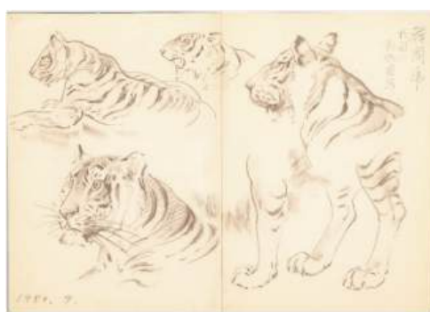
圖 123 林玉山，〈韓國老虎局部〉，1950，粉 彩畫、鉛筆素描，35.6 x50.8 公分，國立臺灣 美術館典藏