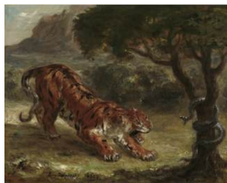
圖 79 德拉克洛瓦，〈老虎和蛇〉 Tiger and Snake ，1862，石版畫印刷，33.02x41.28 公分，美國華盛頓國家藝廊(National Gallery of Art) 典藏 66