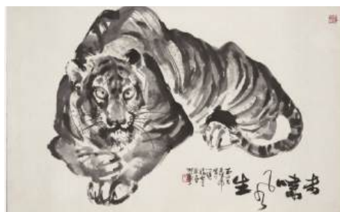
圖 105 林玉山，〈未嘯風生 II〉，1974，水墨紙本，59.5x95.5 公分，國立臺灣美術館典藏