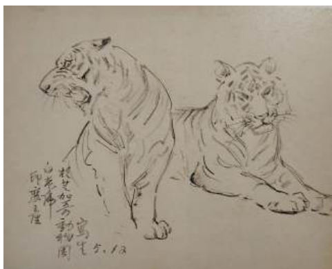
圖 120 林玉山，〈速寫〉，1975，鉛筆素描， 19 x25 公分