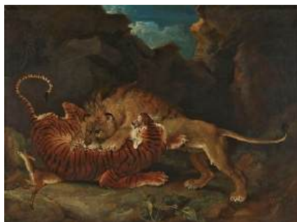
圖 2 詹姆斯·沃德，〈獅子與老虎打鬥〉，1797，油彩畫布，101.6×136.2 公分，劍橋大學費茲威廉博物館典藏