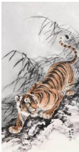
圖 57 林玉山，〈未嘯風生〉，年代未詳，彩墨紙本，設色，尺寸未詳，私人收藏