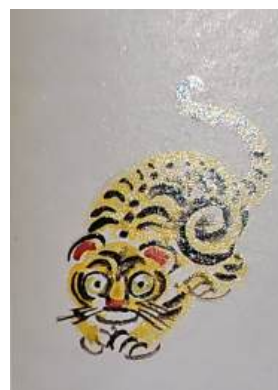
圖 36 林玉山，〈小老虎〉，1982，彩墨紙本，設色，尺存未詳，林玉山家族收藏林玉山為外孫女孫湘婷創作

綜上，母虎與幼虎系列是林玉山重要的描繪主題，深具個人特色，更展現其溫文儒雅、恬適良善之性格，深受大眾喜愛。除了逼真勾出老虎之形，更使筆下之虎，多一份可愛之情。他不只畫一隻幼虎，也畫二隻或三隻幼虎，呈現出多子多孫多福氣的情景。另外，林玉山在含頤弄孫之餘，會為孫子們創作逗趣的小圖，如：〈小老虎〉，可以看出隨筆之創作，卻又顯示出林玉山身為外祖父的反璞歸真，既慈祥又靈活的一面。 46