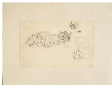
圖 108 德拉克洛瓦，〈臥虎研究〉 Studies of a Crouching Tiger ，年代未詳，鉛筆素描，14x 22.6 公分，Clark Art Institute 典藏

德拉克洛瓦喜愛畫巴黎植物園附屬動物園裡的獅子和老虎的素描，更擔任版畫師，製作蝕刻版畫和石版畫，其中包括動物圖像、北非描繪和文學插圖等。除了以鉛筆的寫生速寫畫虎作品外，還有鋼筆畫的畫虎速寫創作。德拉克洛瓦的野生動物和野馬石版畫創作於 1828-1833 年，當時他正在各個動物園跟隨法國雕塑家好友安托萬·路易斯·巴耶 (Antoine-Louis Barye, 1795-1875) 切磋學習。 85