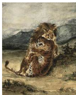
圖 75 德拉克洛瓦，〈獅子和老虎的戰鬥〉 Combat d'un lion et d'un tigre , 1856，水彩 畫，25.1x20.3 公分