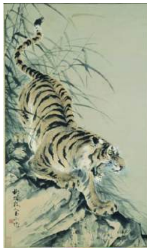
圖 58 林玉山，〈虎嘯圖〉，1986，彩墨紙本，設色，106.5x54.5 公分，國立歷史博物館典藏