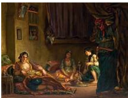
圖 14 德拉克洛瓦，〈公寓裡的阿爾及爾女士〉 Women of Algiers in their Apartment 第二版，1847-1949 年，布面油畫，180x229 公分，法國蒙彼利埃法布爾博物館 (Musée Fabre)典藏

德拉克洛瓦可謂法國人民的驕傲，是法國重量級的畫家，其「天才巨大的藝術成就」 14 長期以來一直受到美國和法國繪畫收藏家的讚賞。他於 1846 年被授予榮譽軍團軍官勳章，並於 1855 年被授予指揮官勳章，並盡可能的利用自己的影響力來促進藝術和藝術家的事業 15 。