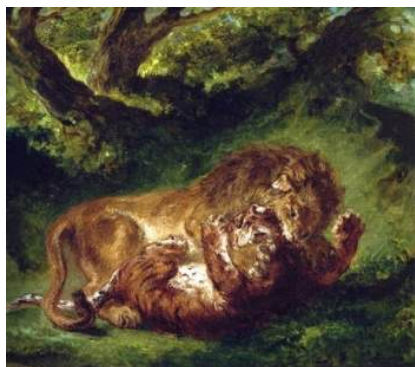
圖 80 德拉克洛瓦，〈獅虎之戰〉 Fight Between a Lion and Tiger ，1863，布面油畫，尺寸未詳，瑞士蘇黎世奧斯卡·萊因哈特藝術館(Oskar Reinhart Collection Winterthur Switzerland 典藏