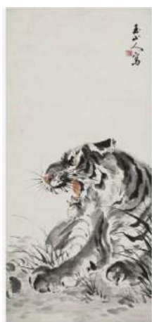
圖 106 林玉山，〈畫虎圖〉，1980，彩墨紙本，設色，82.2x38 公分，國立臺灣美術館典藏