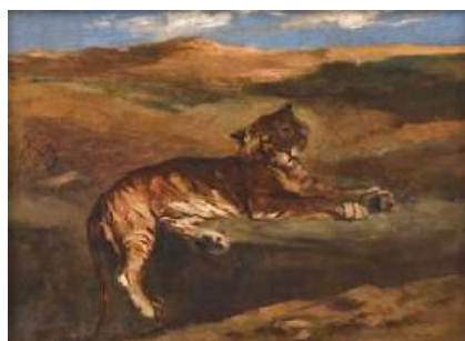
圖 69 德拉克洛瓦，〈沙漠裡的老虎〉 Tiger Resting A Tiger in the Desert ，年代未詳，油彩畫布，32.5x44 公分