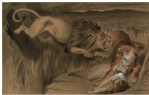
圖 3 約翰·坦尼爾，〈英國雄獅向孟加拉虎的復仇〉，1870 年代，水彩、不透明水彩紙本 23.1×37.4 公分，美國國會圖書館典藏 (Library of Congress)