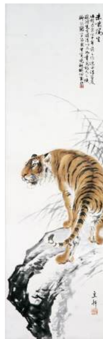
圖 132 林玉山，〈未嘯風生〉，約 1930（1934），彩墨紙本，設色，134x40 公分，長流美術典藏

林玉山內斂的性格也呈現在畫虎作品中，其運筆十分內斂且節制，不是狂放，這樣內斂含蓄的氣質來自於漢學與文化傳統的底蘊，諸如：傳統畫師工筆重彩創作，從小對水墨有基礎接觸、接觸許多中國傳統水墨畫、畫作並題上中國的詩詞等，作畫必求詩意等。這些都是他整個創作當中重要的根基。林玉山曾言：「我是愛讀古書、古早的詩冊。」 101 可見他從所賦之古詩詩句，可捕捉到畫家描繪的情景之外，更具體的呈現出詩畫在作品形式上的融合，而達到詩畫相通的藝術理