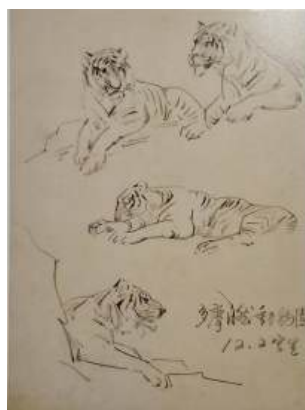
圖 121 林玉山，〈速寫〉，1976，鉛筆素描， 25 x19 公分