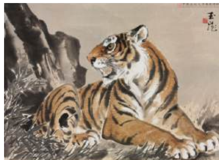
圖 126 林玉山，〈幼虎〉，1971 年，彩墨紙本，設色，45x64 公分，私人收藏