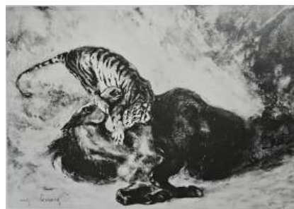
圖 89 德拉克洛瓦，〈野馬被虎撲倒〉 Wild Horse Felled by a Tiger , 1828, 水彩、水粉和阿拉伯膠、鋼筆和棕色墨水簽名，13.5x 20.2 公分，美國紐約大都會博物館(Metropolitan Museum of Art) 典藏