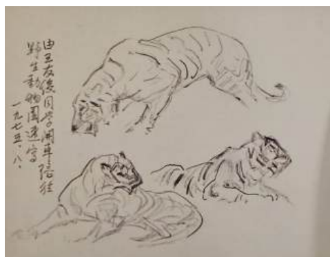
圖 118 林玉山，〈速寫〉，1975，鉛筆素描，19 x 25 公分

林玉山速寫的老虎有幾幅標註創作地點，多數是於動物園的速寫畫虎創作，如下圖，林玉山清楚的表示自己寫生的地點：1975 年野生動物園速寫、美國芝加哥動物園老虎速寫，1966 年多摩自然動物園或是 1990 年長島能場動物園等，由上，可見動物園是林玉山鉛筆速寫的重要場所。從林玉山的老虎速寫可見其他創作了許多不同姿態的虎，線條快速的流動，兒或坐、或躺、或轉身、或趴下、或張嘴等動作，成為林玉山筆下的重要姿態。這些寫生速寫作品更成為他老虎水墨與彩墨創作前重要的素材。學生王秀雄曾表示：「老師（林玉山）拿起鉛筆，馬上就勾畫出來，非常精準。」 88