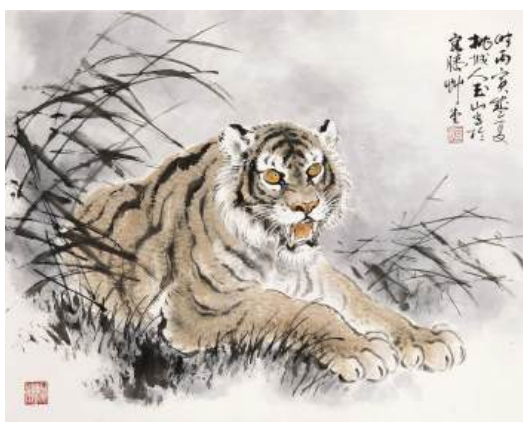
圖 72 林玉山，〈威震八方〉，1986，彩墨紙本，設色，54x68 公分，長流美術館典藏