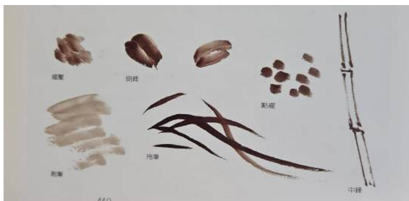
圖 124 林玉山水墨畫法名稱

的構圖法。他又精通水墨與膠彩，但於畫虎設色上，不同於膠彩畫，老虎作品主要以水墨和彩墨暈染。用墨變化多端，墨分五彩，以沒骨為主要的設色技法，老虎或背景是沒有線條的勾勒，這是繼承日本四條派的繪畫技法，而主體老虎已無「逐毛描繪」的方式，但已達到先有寫生，才有寫實的理念。先形似，再神似虎展現根根虎毛畢現的逼真感，其筆下「畫虎畫皮更畫骨」，生動得「未嘯已風生」。雄虎威而不惡，雌虎馴而不兇，更露出母愛溫馨的一面。他還畫出許多小虎、乳虎和幼虎，萌稚可愛，姿態傳神、各具精妙和趣韻，博得人心；而成虎眼光伶俐如電，炯炯有神，不怒而威。筆墨技巧的應用，既有技法的純熟，更有個性淋漓的描繪，畫面的協調與動勢，在色彩與形式的安排相當費心。林玉山曾表示自己的個性保守，缺乏衝力。因此，他的老虎作品反而呈現的是溫馨、威風或以親情為主題的老虎。歷年畫虎之作，皆呈現精謹的結構，例如：1972 年的畫虎作品〈眈眈〉，他畫虎於林葉之間，二眼凝神注目，周全的表達出虎之骨肉、皮毛，以及神氣上的威猛強壯。