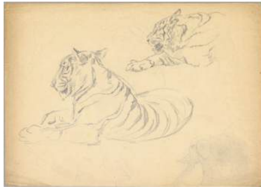
圖 115 林玉山，〈虎一蹲坐一休睡〉，鉛筆素描，25.3 x 35.6 公分，國立臺灣美術館典藏