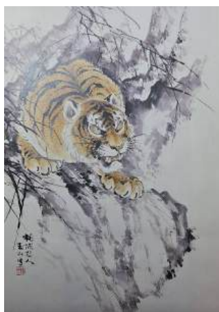
圖 60 林玉山，〈虎穴圖〉，年代未詳，彩墨紙本，設色，815x60 公分，國立歷史博物館典藏