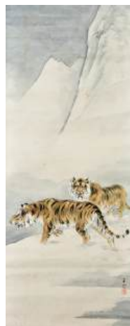
圖 99 林玉山，〈雪地雙虎〉，1995，彩墨紙本，設色，103x41 公分，長流美術館典藏