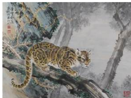
圖 35 林玉山，〈暮色（雲豹）〉，1992，彩墨紙本，設色，69.6x52.2 公分，臺南市美術館典藏