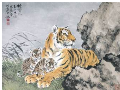
圖 46 林玉山，〈母子情深〉，1990，彩墨紙本，設色，51x67.5 公分，私人收藏