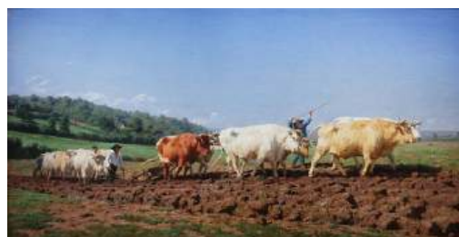
圖 7 羅莎·邦賀(Rosa Bonheur)，〈在納韋爾耕耘〉 Labourage Nivernais ，1852-1855，油彩畫布，133 x260 公分，法國巴黎奧賽博物館 (Musée d'Orsay) 典藏

此文，以西方代表性的法國藝術家歐仁·德拉克洛瓦(Eugène Delacroix, 1798-1863)；以及東方代表的臺灣藝術家林玉山(1907-2004)進行考察研究。二位皆是國寶級的動物畫家，皆有創作老虎題材的創作，具有比較價值和研究意義。