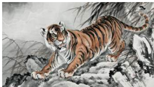
圖 91 林玉山，〈猛虎〉，年代未詳，彩墨紙本，設色，92x165 公分，長流美術館典藏