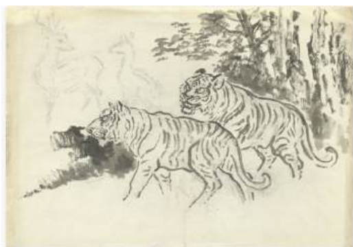
圖 96 林玉山，〈雙虎松鶴〉，尺寸未詳，彩墨紙本，設色，26.9x38.9 x2 公分，國立臺灣美術館典藏

呈上所述，可見林玉山以關懷之心建構出屬於臺灣特有的生命力量。二虎作品中，多以山林或林木為背景進行創作，並從大自然的生態角度來抓臺灣的特色，呈現的景致有靜謐淡雅或氣勢澎湃的直豎岩壁。此類屬於林玉山較晚期的作品，筆墨之表現由精細趨於豪放，主題包含靜態的竹林、巨山和動態的虎。此外，以透視法來表現出高聳山林，寒冷的雪景、路途遙遠以及無窮無盡之感，如下圖，二虎走路之風相似，十分威風：