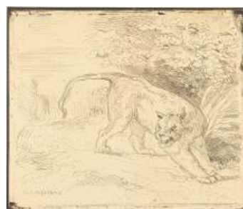
圖 111 德拉克洛瓦，〈老虎停下腳步〉，1828，照相蝕刻、網紋紙，16.7x 19.8 公分，美國華盛頓國家美術館(National Gallery of Art, Washington, D.C.)典藏