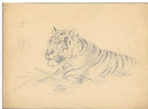
圖 117 林玉山，〈半身老虎〉，鉛筆素描，26.1 x 35.8 公分，國立臺灣美術館典藏

林玉山速寫的老虎有幾幅標註創作地點，多數是於動物園的速寫畫虎創作，如下圖，林玉山清楚的表示自己寫生的地點：1975 年野生動物園速寫、美國芝加哥動物園老虎速寫，1966 年多摩自然動物園或是 1990 年長島能場動物園等，由上，可見動物園是林玉山鉛筆速寫的重要場所。從林玉山的老虎速寫可見其他創作了許多不同姿態的虎，線條快速的流動，兒或坐、或躺、或轉身、或趴下、或張嘴等動作，成為林玉山筆下的重要姿態。這些寫生速寫作品更成為他老虎水墨與彩墨創作前重要的素材。學生王秀雄曾表示：「老師（林玉山）拿起鉛筆，馬上就勾畫出來，非常精準。」 88