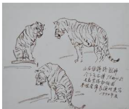
圖 122 林玉山，〈速寫〉，1976，鉛筆素描， 25 x19 公分