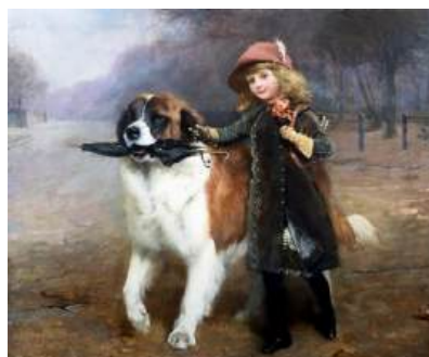
圖 5 查爾斯·伯頓·巴伯，〈去學校〉 Off to School ，1883，布面油畫，20x24 公分，私人收藏