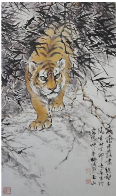
圖 63 林玉山，〈猛虎〉，1987，彩墨紙本，設色，91x59 公分，國立歷史博物館典藏