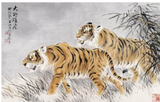
圖 97 林玉山，〈大野雄風〉，1995，彩墨紙本，設色，69x109 公分，長流美術館典藏