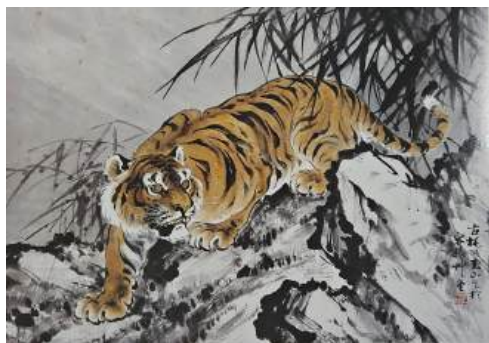
圖 61 林玉山，〈虎〉，1986，彩墨紙本，設色，60x101 公分，國立歷史博物館典藏