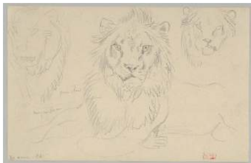
圖 9 德拉克洛瓦，〈獅子，全臉〉，1841 年 8 月 30 日，石墨，11.7 x 18.3 公分，美國紐約大都會博物館(Metropolitan Museum of Art) 典藏

照明來觀察。德拉克洛瓦將它各種姿態都畫了下來，試圖理解每一塊肌肉的運作。他最震撼的是：獅子的前腿竟像是一隻扭曲、翻轉的人類巨臂。依他所言，在所有人類形體中，都潛藏著或清晰或模糊的動物形態，值得加以辨析。他補充說，若持續研究人與動物之間的類似之處，便能在人的身上發現那些模糊的本能，揭示其內在本性如何與某種動物相近。 8