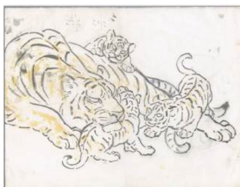
圖 48 林玉山，〈母子親（虎）〉，年代未詳，鉛筆素描，設色，46.3x60.7 公分，國立臺灣美術館典藏