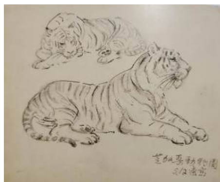
圖 119 林玉山，〈速寫〉，1975，鉛筆素描，19 x 25 公分