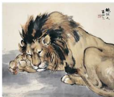
圖 34 林玉山，〈養氣〉，1975，彩墨紙本，設色，64x76 公分，長流美術館典藏