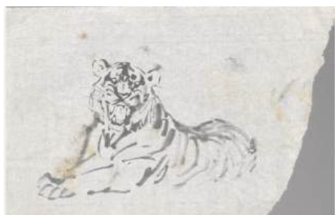
圖 104 林玉山，〈坐虎〉，年代未詳，水墨紙本，30.6x47.3 公分，國立臺灣美術館典藏