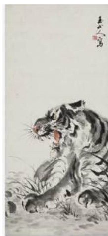
圖 73 林玉山，〈畫虎圖〉，1980，彩墨紙本，設色，82.2x38 公分，國立臺灣美術館典藏