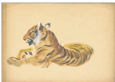
圖 70 林玉山，虎一蹲坐（彩色），水彩，25.3 x 35.6 公分，國立臺灣美術館典藏