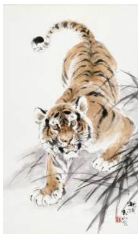
圖 127 林玉山，〈猛虎下山〉，年代未詳，尺寸不詳，彩墨紙本，設色，60x36 公分，長流美術典藏