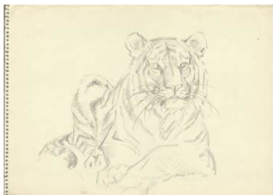
圖 116 林玉山，〈虎坐姿〉，1986，鉛筆素描，35.5 x 25.4 公分，國立臺灣美術館典藏