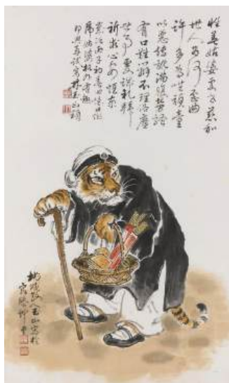
圖 32 林玉山，〈虎姑婆〉，1996，彩墨淡彩紙本，設色，68.8 x 41.5 公分，國立臺灣美術館典藏 42