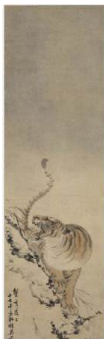
圖 17 林玉山，〈下山猛虎〉，1923 年，彩墨淡彩紙本，設色，132.1 x 39.1 公分，國立臺灣美術館典藏

同一時期（同一年），官展畫家呂鐵州(1899-1942)也創作了老虎題材的作品〈虎〉。而呂鐵州的弟子呂孟津(1898-1977)亦創作了老虎題材的作品，可見日治時期畫虎是臺灣當時藝術家重要創作的題材。