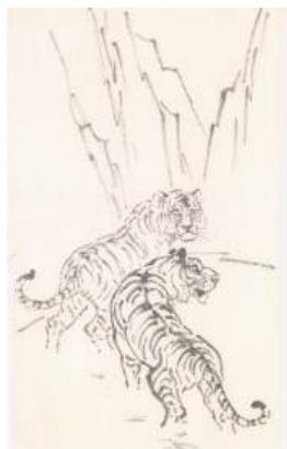
圖 102 林玉山，〈畫虎圖〉，年代未詳，水墨紙本，29.1x17.5 公分，國立臺灣美術館典藏