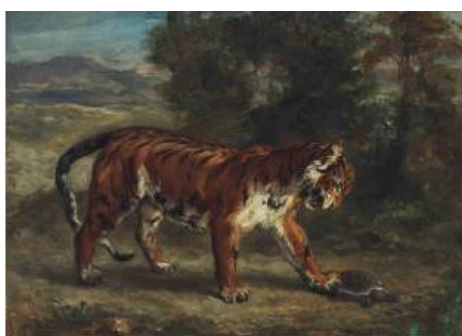
圖 86 德拉克洛瓦，〈老虎戲弄烏龜〉 Tiger Teasing Turtle , 1862, 油彩畫布， 45.1x 62.2 公分，私人收藏

〈下山猛虎〉是林玉山最早畫虎作品，此作「完全表現了活生生的山林猛虎的動態，比例正確，形體自然，與民間虎畫的象徵手法截然不同。林玉山一生畫虎的功力，早在十七歲的這張虎畫，就已展現出來，著實令人刮目相看。」 53 林玉山在構圖上，先為畫面留白，並以斜對角構圖方凸顯主角之虎；線條呈現上，用筆流暢細膩，勾勒出老虎的表情、形態與神韻，筆下的虎栩栩如生，虎虎生風。從下圖〈猛虎〉、〈下山猛虎〉和〈猛虎下山〉三幅畫作中可見林玉山老虎的筆墨線條與毛色濃淡的變化再現，畫中老虎緩步下山之英姿氣勢與神情隱然可見。