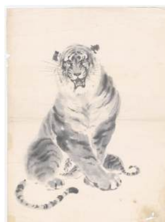
圖 107 林玉山，〈畫虎圖〉，年代未詳，水墨紙本，設色，43.1x31.1 公分，國立臺灣美術館典藏