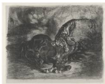
圖 109 德拉克洛瓦，〈野馬被虎撲倒〉 Wild Horse Felled by a Tiger ，年代未詳，鉛筆素描（石版畫，水墨畫），22.2x28.6 公分，Clark Art Institute 典藏