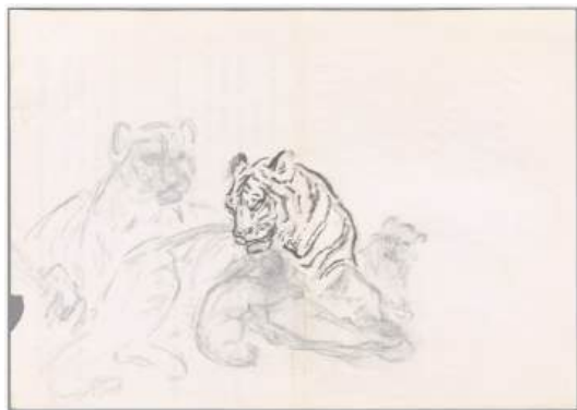
圖 114 林玉山，〈老虎〉，鉛筆素描，25.7 x 36.4 公分，國立臺灣美術館典藏

寫生是繪畫的重要基礎，同時也是作畫的過程工作。有堅實的寫生經驗才能胸有成竹，包羅萬象，由造畫中採擷生機和無盡的資源，為創作時的基石。寫生的意義是一種科學的探討自然、感覺的意識層次，而達到物我兩忘，所謂天人合一的修養功夫。 87