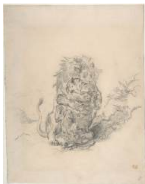
圖 30 德拉克洛瓦，〈獅子和老虎，戰鬥〉 A Lion and a Tiger, Fighting (Struggle between a lion and a tiger) ，1854，石墨畫，31.3x24.1 公分，美國紐約大都會博物館(Metropolitan Museum of Art) 典藏