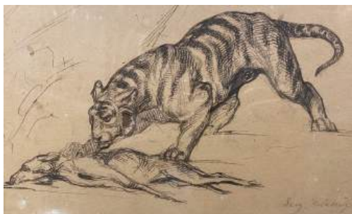
圖 112 德拉克洛瓦，〈老虎研究〉，年代未詳，鋼筆畫，15x 24.5 公分，私人收藏