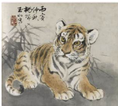
圖 37 林玉山，〈乳虎圖〉，1986，彩墨紙本，設色，23x27 公分，國立臺灣美術館典藏