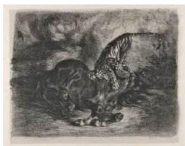
圖 110 德拉克洛瓦，〈野馬遭虎撲擊〉，1828，石版畫，22.2x 28.6 公分，美國紐約大都會博物館(Metropolitan Museum of Art) 典藏