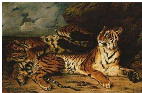
圖 94 德拉克洛瓦，〈一隻小老虎和媽媽一起嬉戲玩耍〉 A Young Tiger playing with its Mother ，1830 年，布面油畫，131x194.5 公分，法國巴黎羅浮宮(Musée du Louvre)典藏

德拉克洛瓦二隻老虎主題的作品僅有〈一隻小老虎和媽媽一起嬉戲玩耍〉 A Young Tiger playing with its Mother 此件以及石版畫作品，但經由筆者梳理老虎圖像後，可以發現德拉克洛瓦的虎幾乎不見二隻虎同時出現在畫作，反而是與其他動物或是人物相襯或是僅有單單一隻老虎於畫面，此不同於林玉山之畫。