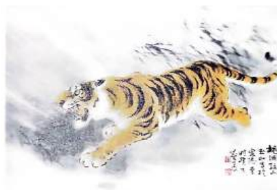
圖 83 林玉山，〈奔虎〉，1983，彩墨紙本，設色，41x62 公分