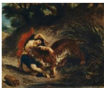
圖 74 德拉克洛瓦，〈年輕女子被老虎攻擊〉 Young Woman Attacked By A Tiger , 1856，油彩 畫布，51x 61.3 公分，德國斯圖加特國家美術 館 (Staatsgalerie Stuttgart) 典藏

更有趣的是，我們從這系列可以看出德拉克洛瓦幾乎以人與虎之鬥，以及森林之王老虎與獅子之鬥為主題，常理來看，老虎與獅子不會碰在一起，因為老虎多生長在亞洲叢林中，獅子則是大多生長在非洲草原上，這又更印證出德拉克洛瓦的獵奇心態和異國風情的想像力。