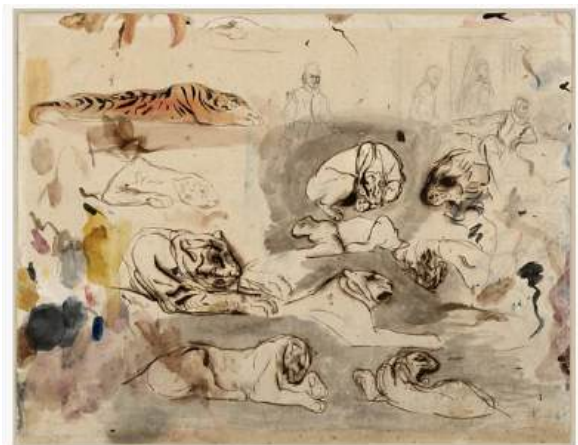
圖 65 德拉克洛瓦，〈十六世紀服飾中的老虎與人的素描〉 Sketches of Tigers and Men in Sixteenth-Century Costume ，1828-1829，水彩畫、鋼筆、鐵膽墨水和象牙色直紋紙上的石墨，39.7x51 公分，芝加哥藝術學院、大衛阿德勒紀念基金

其中，德拉克洛瓦〈老虎和蛇〉和〈皇家虎〉二件畫虎作品構圖相近，〈皇家虎〉奔放的構圖與繽紛的顏色帶來強烈的視覺效果，以蠟筆、筆刷、刮刀的實驗性技巧來呈現老虎黑白相間的漂亮紋路、發亮的毛以及絲絨般的質感。二幅之前景皆為細草與蕨類植物；中間是長趴卧在地上、伺機而動或若有所思的老虎；遠景細草、高山和雲霧相互映襯，此出前、中和後景的構圖形式，呈現靜態之美。德拉克洛瓦之虎展現高貴的氣質、散發泰然自若的氣息，可見他更重老虎整體的型態輪廓，不同於林玉山注重虎的五官、腳掌的細緻度、他清晰的鬍鬚玉鬢毛以及構圖留白的效果等，同時他也注重老虎紋路的流暢性與流動感。另，林玉山還會在畫面中增添搖曳的竹子和小草，並為畫作題字，而畫作也因這些景物的搭配與襯托，顯豐富性動態感。