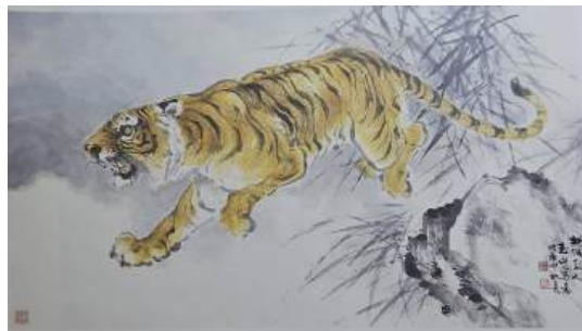
圖 85 林玉山，〈虎〉，年代未詳，彩墨紙本，設色，69x125 公分，國立歷史博物館典藏