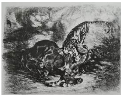
圖 90 德拉克洛瓦，〈野馬被虎撲倒〉 Wild Horse Felled by a Tiger ，1828，平版印刷，21.9x 28.3 公分，美國紐約大都會博物館 (Metropolitan Museum of Art) 典藏