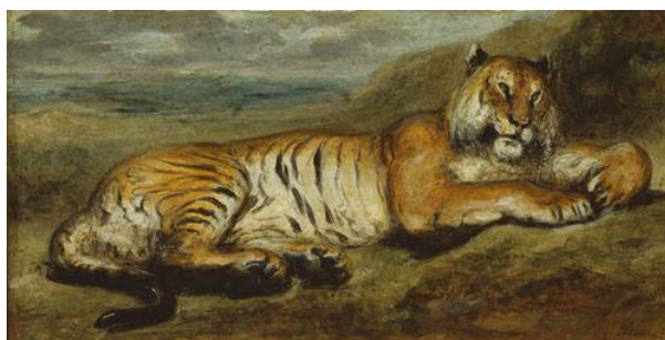
圖 68 德拉克洛瓦，〈老虎休憩〉 Tiger Resting ，1830，油彩畫布，尺寸未詳，美國芝加哥藝術學院(Art Institute of Chicago, United States)典藏