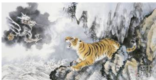
圖 82 林玉山，〈風雲際會〉，1992，彩墨紙本，設色，67x135 公分，長流美術館典藏

臺灣美術史學者蕭瓊瑞讚美林玉山對於貓科動物即將迸發衝出來的那一剎那，是一種凝聚力，表現其沉穩當中的爆發的生命力，不失他典雅的風範。而那種衝力、強勁，在沉穩中有一股力量要爆發，他如此評論「……貓科動物，那種躡手躡腳，然後要衝刺的那種感覺。畫得那樣的強勁有力，……用水墨來畫，而且水墨的層次之豐富。」 75 老虎從雲和山出來的氣魄，是十分有張力的。林玉山所畫之生氣的老虎其耳朵、眼神是用鐵線描，老虎的生氣才會流露出來。 76 而這種筆墨所具有的氣勢和力量感、速度感，是有情韻和節奏的，意趣及所造成境界的生動寫照，是其筆墨的造詣。 77