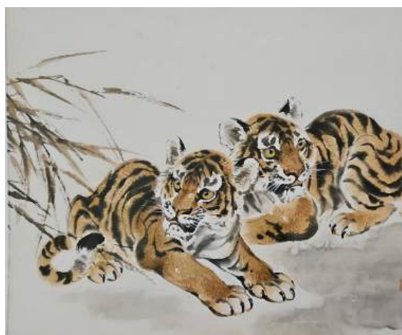
圖 42 林玉山，〈二隻老虎〉，約 1980，彩墨紙本，設色，45x59 公分，私人收藏