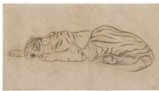
圖 113 德拉克洛瓦，〈皇家虎〉，1829，黑色筆畫，24.29x 44.29 公分，私人收藏

林玉山喜愛前往動物園觀賞老虎，還會問動物管理員關於老虎的相關問題，例如：如何分辨雄虎與雌虎等？他對於老虎的毛色、斑紋、骨骼、體態，及威武的表情等，都用心察看體會，亦用鉛筆做過描寫。 86 林玉山也會特別研究虎的身體架構、特徵、習性和生活環境。兒子林柏亭亦曾表示小時候爸爸就常帶他去動物園玩耍，觀察動物。林玉山明確表示：