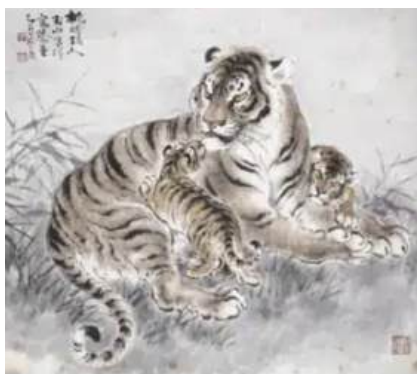
圖 45 林玉山，〈虎母子〉，1985，彩墨紙本，設色，62x70 公分，長流美術館典藏