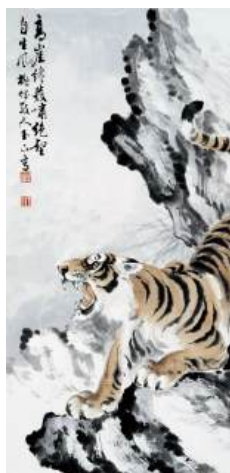
圖 56 林玉山，〈絕壑生風〉，年代不詳，彩墨紙本，設色，69x33.5 公分，長流美術典藏