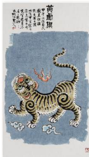
圖 33 林玉山，〈黃虎旗〉 43 ，1974，彩墨淡彩紙本，設色，118 x 67 公分，國立臺灣美術館典藏