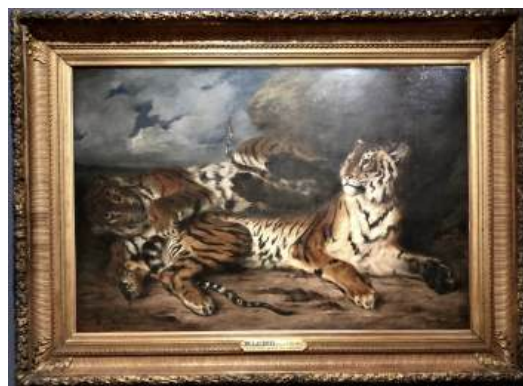
圖 134 西方德拉克洛瓦畫虎作品（法國羅浮宮之裱框方式）