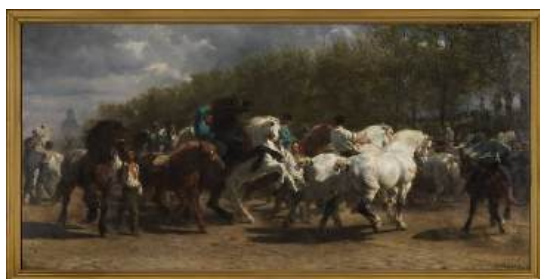
圖 6 羅莎·邦賀(Rosa Bonheur)，〈馬市〉 The Horse Fair ，1852-1855，油彩畫布，244.5 x 506.7 公分，美國紐約大都會博物館 (Metropolitan Museum of Art) 典藏