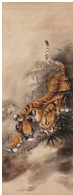
圖 18 呂鐵州，〈虎〉，1923 年，彩墨淡彩紙本，設色，尺寸未詳，臺北市立美術館典藏