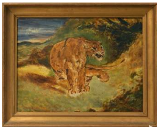
圖 49 德拉克洛瓦，〈坐虎咆哮〉 In the style of Sitting Tiger ，年代未詳，油彩畫布，25x32 公分

林玉山的走獸之虎，取其神之祕法，他藉由寫生觀察老虎，注意其視聽，咆哮示威。或行、或臥、或仰諸態。 55 其中，林玉山〈回首猛虎〉和〈斗方虎〉是留白無背景之創作，描繪一猛虎之雄姿，虎二前肢直立，後肢蹲坐，回首翹望。其蹲坐而回首凝視之姿，彰顯其龐大身軀，而虎眼圓睜似緊盯著觀眾，表情莊重而威武。筆墨線條細膩流暢，老虎背上的黑色條紋路十分清晰，形神兼具，栩栩如生。〈斗方虎〉以斗方幅式完成，考驗畫家章法布局之功力。老虎的毛髮則以拖筆的方式呈現，畫中之虎毛絨絨。此外，林玉山為畫作題詩，展現東方藝術「提畫詩」之元素，這與德拉克洛瓦之虎截然不同。