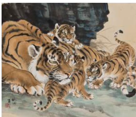
圖 47 林玉山，〈虎母子（母愛）〉，1965（約 1960），彩墨設色，75.5x65.1 公分，嘉義市立美術館典藏