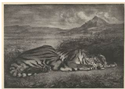
圖 67 德拉克洛瓦，〈皇家虎〉 Royal Tiger ，1829，平版畫，32.7x47 公分，克利夫蘭藝術博物館(The Cleveland Museum of Art)典藏