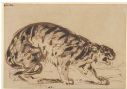
圖 100 德拉克洛瓦，〈臥虎〉 Crouching Tiger , 1839，筆、毛筆和鐵膽墨水，13.1x18.7 公分，美國紐約大都會博物館 (Metropolitan Museum of Art) 典藏

德拉克洛瓦〈臥虎〉和〈景觀中的老虎〉二件作品描繪了老虎即將猛撲的弓形姿態，這是德拉克洛瓦少有的具水墨之感的老虎速寫黑白作品，除了鋼筆之外，他還使用毛筆和鐵膽墨水更大膽表達流動的線條，呈現出如水墨般的效果，例如：老虎圓凸彎曲的背部、後腿的摺痕、纏於後腳、捲曲的尾巴以及動物皮毛上獨特的寬條紋。纏繞在動物腿上的尾巴旋轉成 S 形曲線，增加了此姿勢的盤繞力道，亦增添了畫面的動勢和效果，這與東方藝術效果似乎有些相似，此頗有異曲同工之妙。不過，與東方水墨媒材的使用又有所差異，此系列媒材皆能製造出濃淡深淺之效果，即使表現的是黑白之老虎，媒材反而是以筆、毛筆和鐵膽墨水來完成。