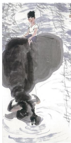
圖 2 李奇茂，《嬉戲》，1977，水墨設色、紙本，尺寸未詳