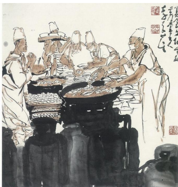
圖 8 李奇茂，《臺灣采風》，2003，水墨設色、紙本，70.5X69CM