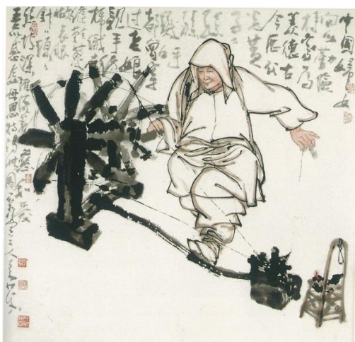
圖 1 李奇茂，《慈母手中線》，2006，水墨設色、紙本，115X120CM

中，大膽奔放的筆墨獨具開創性，詮釋台灣城鄉之美，這份生活的美讓人覺得既熟悉又親切。透過李奇茂的作品：《慈母手中線》(圖 1)呈現內心對親情的崇拜；《嬉戲》(圖 2)展現人與水牛的靈活互動；《媽祖出巡》(圖 3)傳神地表達民俗信仰的熱鬧非凡；《北淡捷運》(圖 4)描繪臺北地區通勤族的自然樣貌，貼近你我生活日常；《台北夜市人生》(圖 5)更是淋漓盡致描繪市集的盛況，充分反映出台灣社會的生活和人情味。這些作品都讓觀賞者透過李奇茂教授的眼和心，去看見日常生活的細節和美好。