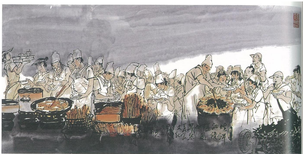
圖 9 李奇茂，《燒餅油條》，年份未詳，水墨設色、紙本，70X137CM