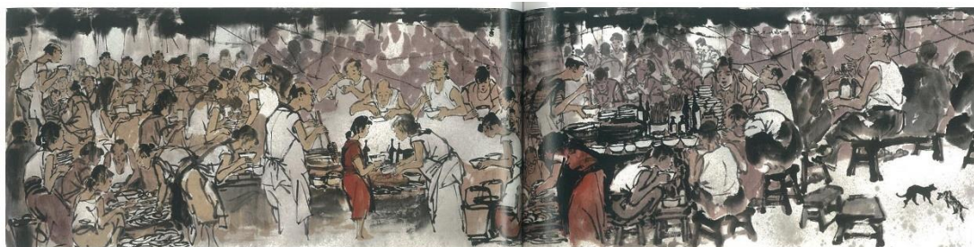
圖 7 李奇茂，《大夜市》，1991，水墨設色、紙本，53X230CM

(圖片出處：潘禧，2014，《采風·神韻：李奇茂》，頁 91，國立臺灣美術館，時報文化。)