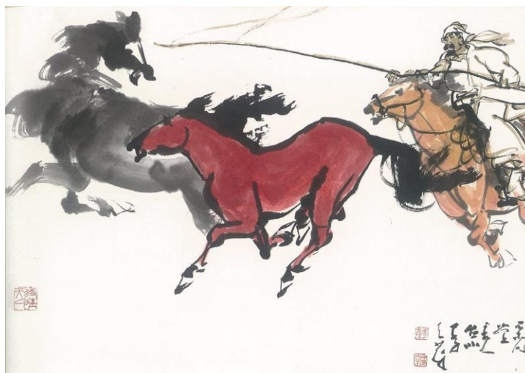
圖 10 李奇茂，《套馬》，2010，水墨設色、紙本，70X100CM