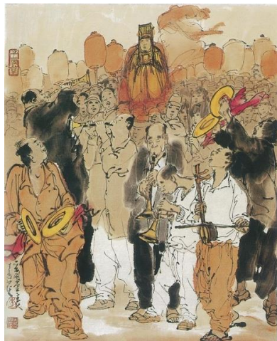
圖 3 李奇茂，《媽祖出巡》，1980，水墨設色、紙本，尺寸未詳

(圖片出處：潘潘，2014，《采風·神韻：李奇茂》，頁 67，國立臺灣美術館，時報文化。)