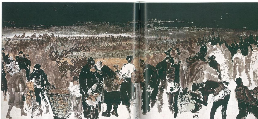
圖 5 李奇茂，《台北夜市人生》，2012，水墨設色、紙本，191X450CM