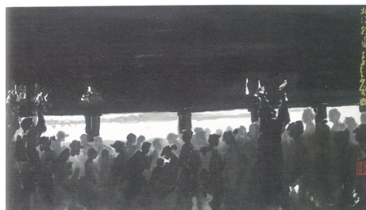
圖 4 李奇茂，《北淡捷運》2009，水墨設色、紙本，22X47CM

(圖片出處：潘潘，2014，《采風·神韻：李奇茂》，頁 21，國立臺灣美術館，時報文化。)